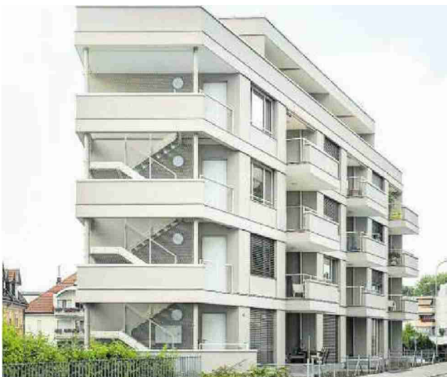
Wohnhaus Röschstrasse in St. Gallen.

Mit dem ersten Rang der Region Ost würdigt die Prix-Lignum-Jury das Mehrfamilienhaus Röschstrasse in St.Gallen der Forrer Stieger Architekten AG. Der Bau, der auf den ersten Blick wie ein Neubau erscheint, ist aber tatsächlich eine Aufstockung im grossen Stil. Auf der spitz zulaufenden Parzelle stand ein Gewerbebau, in dessen Untergeschoss am Hang ein Linsenschleifer arbeitete. Damit die Maschinen auch während des Umbaus weiterlaufen konnten, entschied der Bauherr, die beiden Obergeschosse durch fünf Stockwerke in Holzbauweise zu ersetzen. (pd)