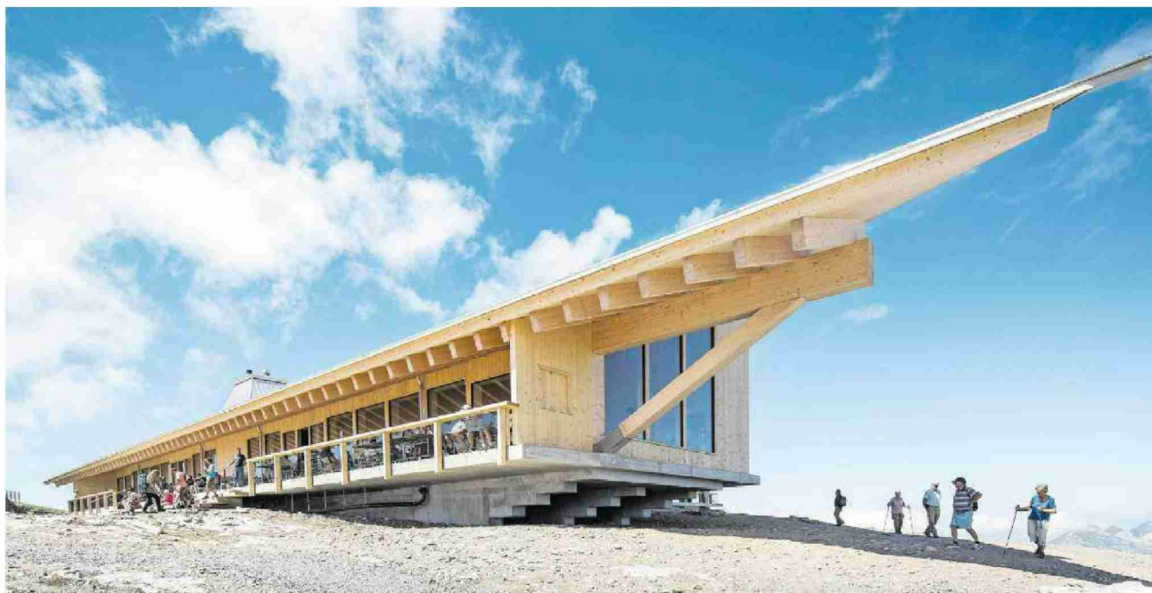
Die ausgezeichnete Bergstation auf dem Chäserrugg ist ein reiner Holzbau, der auf einem Betonsockel ruht.