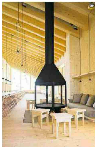
Zimmermannsarbeit aus heimischer Fichte.